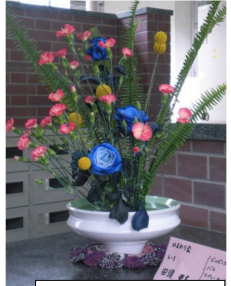
6年3組 田頭 亜美さんの作品